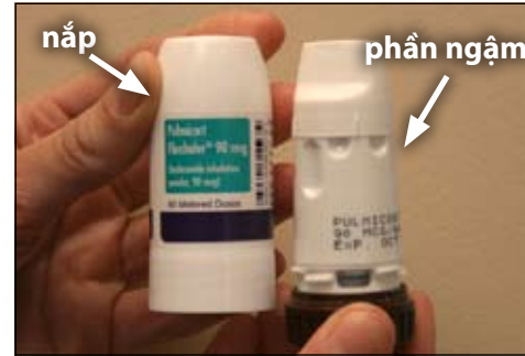
2. Đây là nắp và phần ngậm