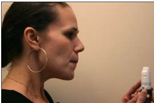
8. Giữ hơi thở trong 10 giây nếu được