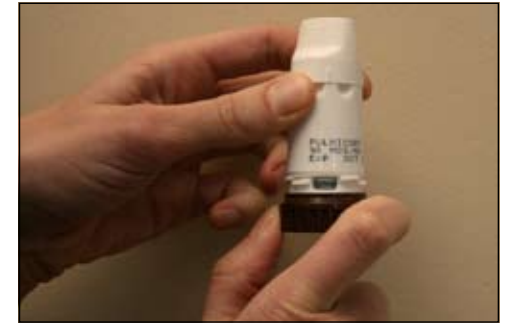
3. Cắm bộ phận ngậm