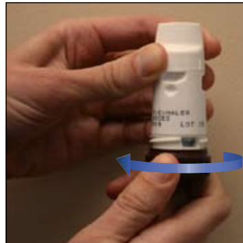
5. Sau đó vặn ngược lại để nghe tiếng "tách" Ống hít đã sẵn sàng để sử dụng