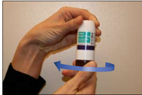
1. Vặn phần đáy như trên để mở nắp