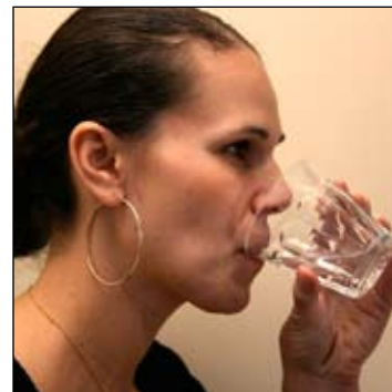
9. Súc miệng bằng nước và phun RA