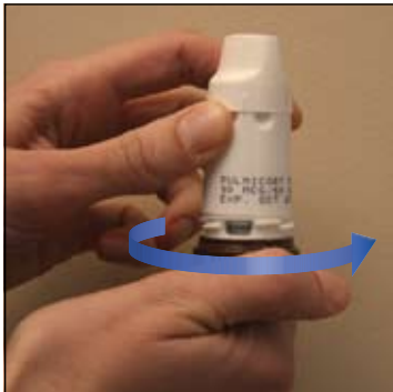
4. Vặn phần đáy theo hướng này