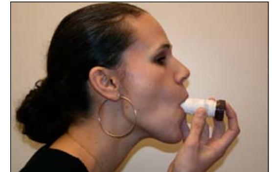
7. Ngậm ở bộ phận ngậm. Thở VÀO nhanh và sâu