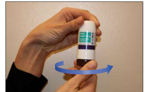
10. Đậy nắp lại, vặn để đóng lại