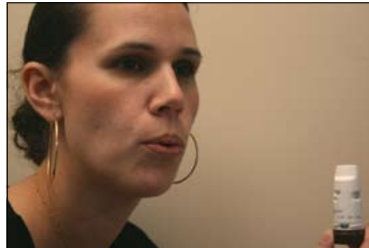
6. Thở RA và CÁCH XA ống hít