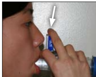
8. PNhấn xuống ở đây CÙNG LÚC VỚI khi bạn thở VÀO chậm và sâu