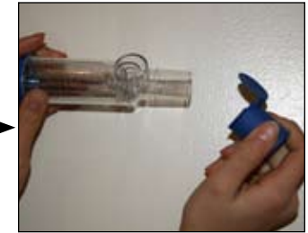
2. Remova a tampa do bocal