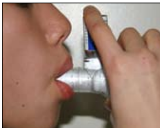
7. Coloque os lábios ao redor do bocal