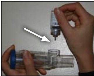
3. Coloque o frasco dentro do Optihaler assim