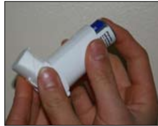
1. Retire kanistè la nan kontènè plastik la