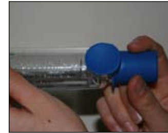
2. Retire kouvèti pyès pou bouch la