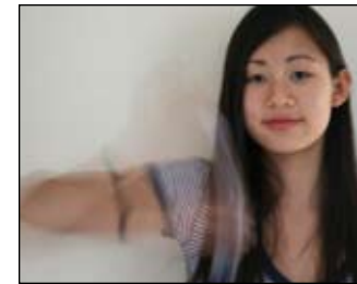
5. Souke byen