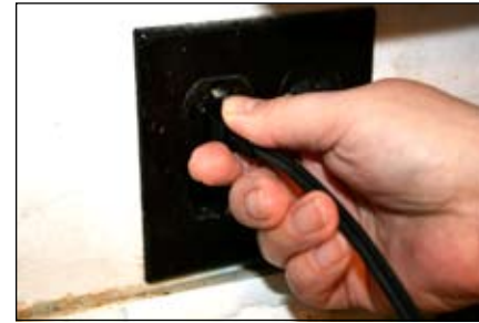
3. Cắm điện vào