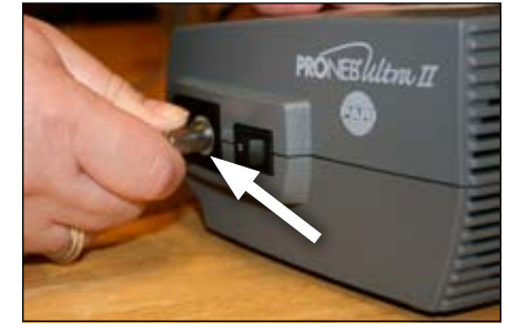
4. Gắn một đầu đường ống vào máy bơm