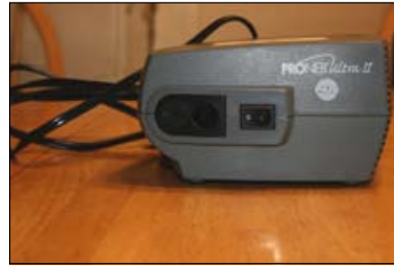
2. Đặt máy bơm lên một mặt phẳng, chắc chắn