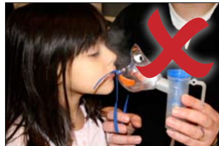
SAI! KHÔNG để mặt nạ trước mặt