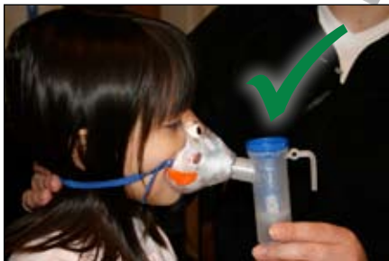
9. Đặt mặt nạ lên mũi và miệng. Thở chậm, sâu bằng MIỆNG