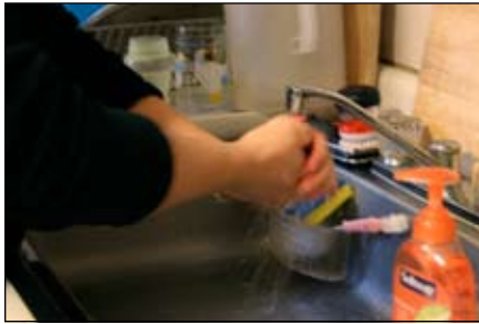
1. Rửa tay