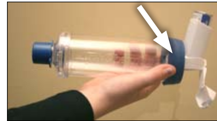
3. 將吸入器接到分隔器