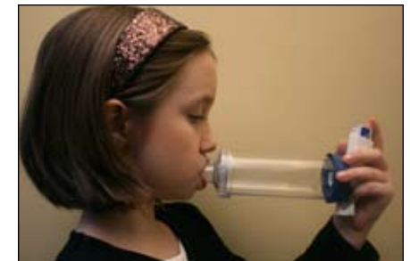
8. 慢慢將藥物深深吸入