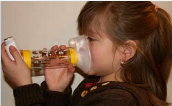
4. Derecho y póngase la mascarilla sobre la nariz y la boca