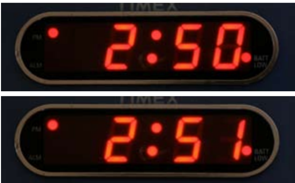
Si necesita otra inhalación del medicamento, espere UN minuto. Después repita los pasos 4 a 6