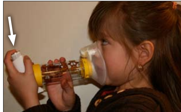
5. Apriete aquí hacia abajo. Eso hace que entre medicamento al espaciador