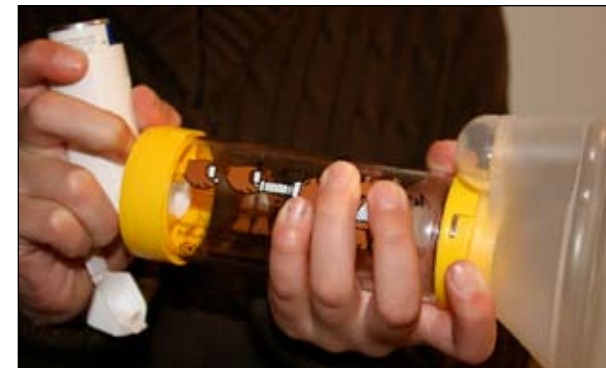
3. 然後將吸入器接到分隔器