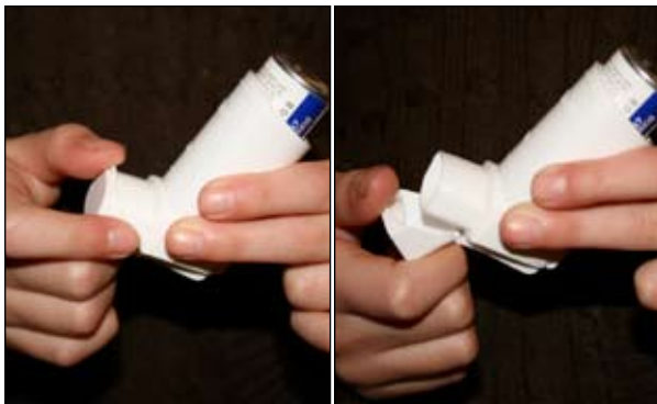
1. 將吸入器的蓋打開