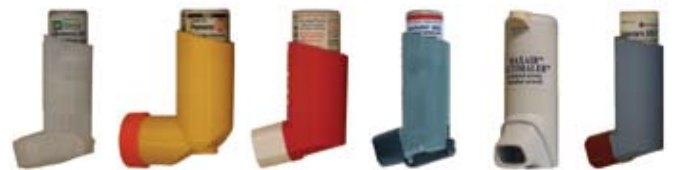
Albuterol Proventil ProAir Ventolin Maxair Xopenex