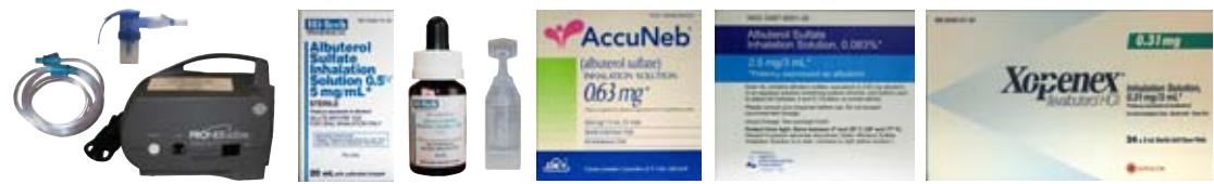
thuốc dạng bơm xịt (nebulizer medications)