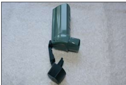
3. Để khô qua đêm