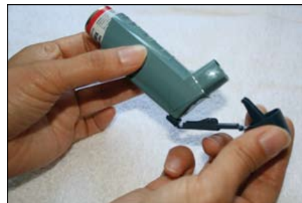
4. Lắp ống thuốc và bộ phận ngậm lại sau khi bộ phận ngậm đã khô ráo