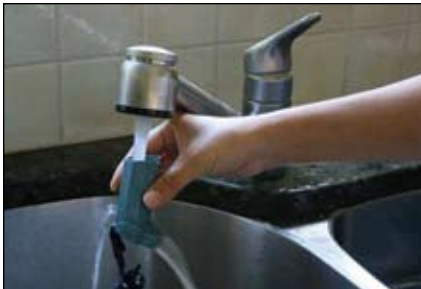
2. Rửa bộ phận ngậm bằng nước ấm