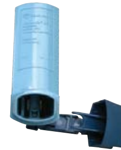
Bộ phận ngậm

Thuốc thoát ra khỏi cái lỗ nhỏ này và rất dễ bị kẹt đọng lại đó. Bộ phận ngậm phải sạch sẽ VÀ khô ráo để ống hít có tác dụng.