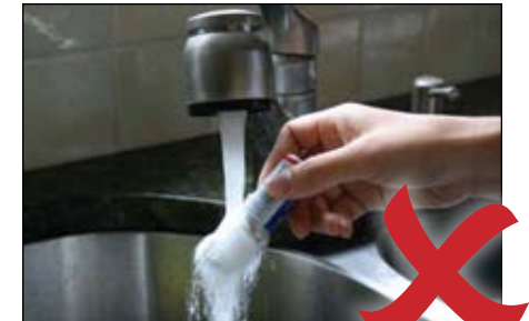
KHÔNG rửa ống thuốc!