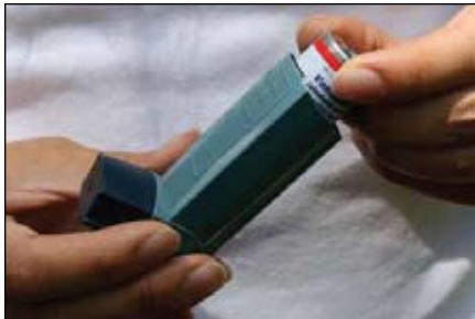
1. Lấy ống thuốc ra khỏi bộ phận ngậm