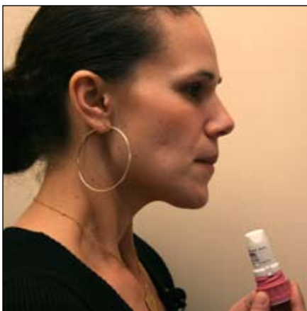
5. Aguante la respiración por 10 segundos, si puede