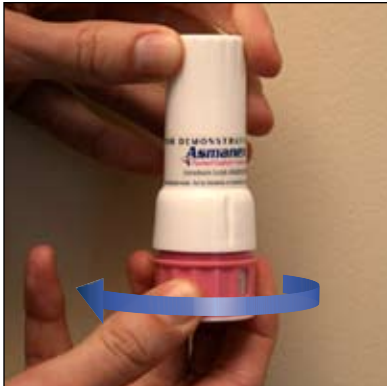
1. Gire así la parte de abajo para sacar la tapa