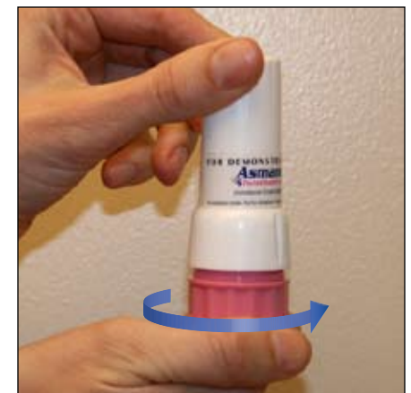
7. Ponga la tapa y gírela para cerrarlas