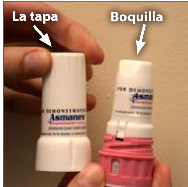
2. Aquí están el tapón y la boquilla