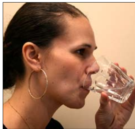
6. Enjuáguese la boca con agua y ESCUPE