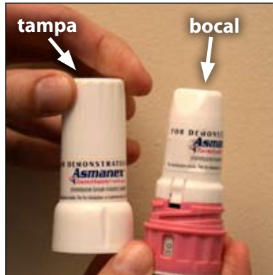
2. Estes são a tampa e o bocal