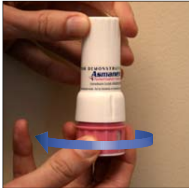
1. Gire a parte inferior assim para remover a tampa