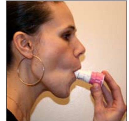
4. Feche seus lábios ao redor do bocal e INSPIRE rápida e profundamente